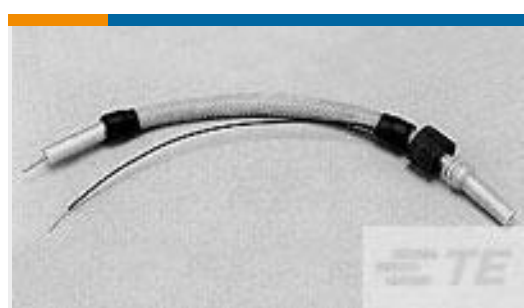
TE 产品编号862547-9 LEAD, SGL END ASSY, LGH