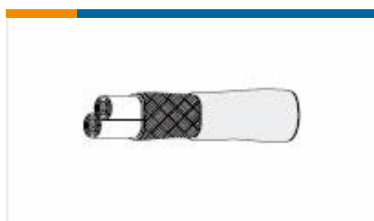
TE 产品编号8437253001 55A1141-26-0/2/6/9-9