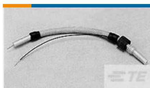
TE 产品编号1-862545-8 LEAD, SGL END ASSY, LGH