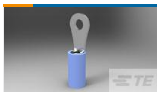
TE 产品编号8-328996-1 TERMINAL,PIDG R 16-14 4