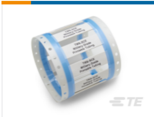
TE 产品编号245965-000 TMS-SCE Military Grade Sleeves