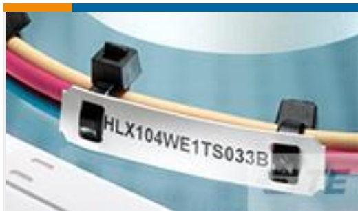
TE 产品编号EC7654-000 HLX203YW1TS050B