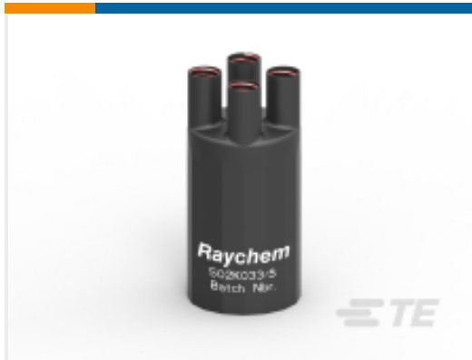
TE 产品编号E00553N001 502K033/S(S15)