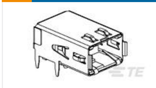
TE 产品编号1761072-3 RECPT,HSSDC2,FIBRE,TRAY PKG