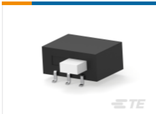
TE 产品编号1-1437581-1 ASE22RL=AUTOSLIDE DP