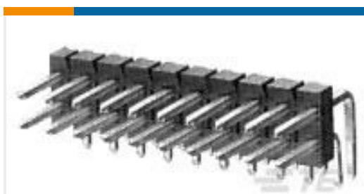
TE 产品编号 4-829290-9 2X49P MOD2 STIFTLEI