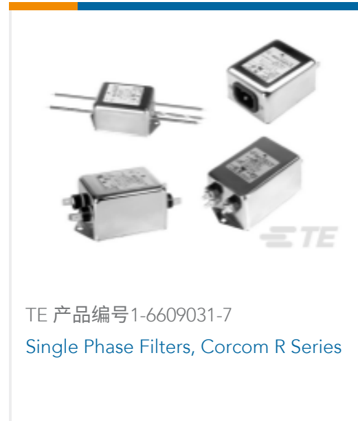
TE 产品编号1-6609031-7 Single Phase Filters, Corcom R Series