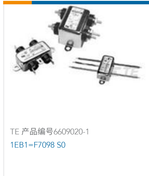
TE 产品编号6609020-1 1EB1=F7098 S0