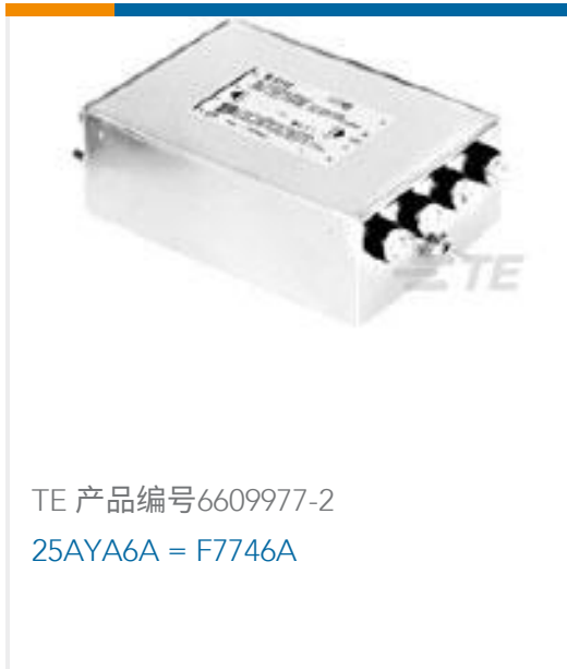
TE 产品编号6609977-2 25AYA6A = F7746A