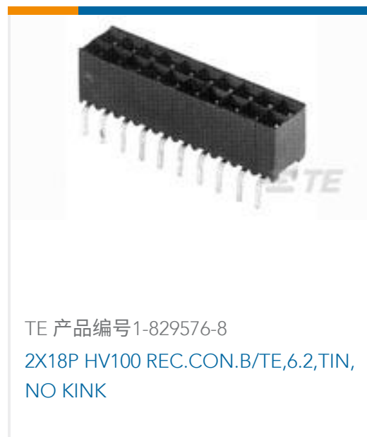
TE 产品编号1-829576-8 2X18P HV100 REC.CON.B/TE,6.2,TIN, NO KINK