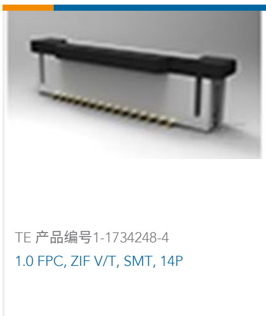
TE 产品编号1-1734248-4 1.0 FPC, ZIF V/T, SMT, 14P