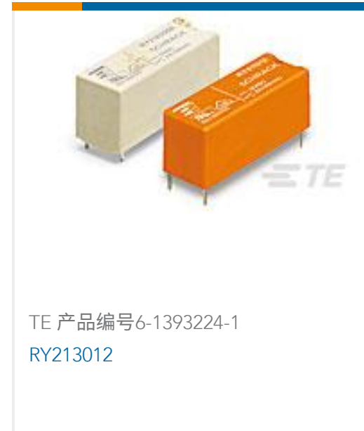
TE 产品编号6-1393224-1 RY213012