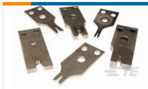
TE 产品编号3-459736-4 CRIMPER, WIRE "F" SPLICE TYPE