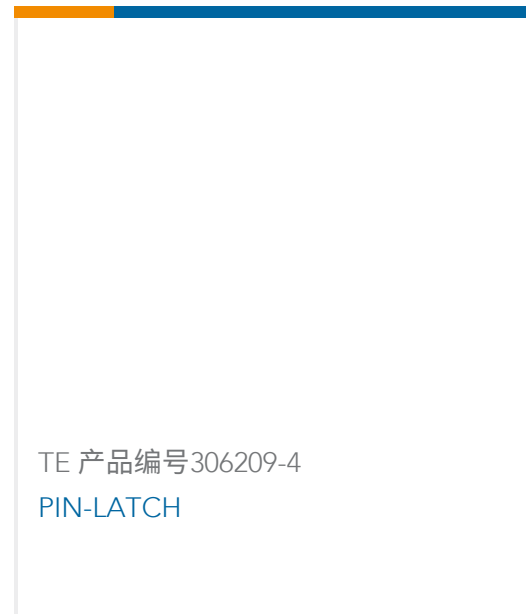
TE 产品编号306209-4 PIN-LATCH