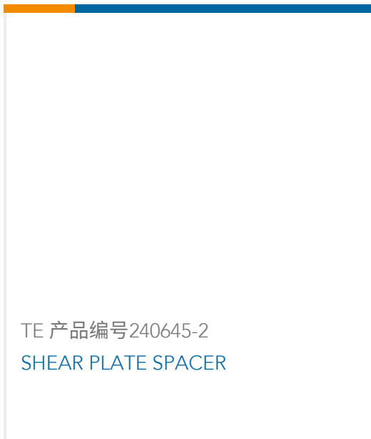
TE 产品编号240645-2 SHEAR PLATE SPACER