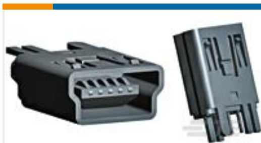
TE 产品编号1734753-1 MINI USB, TYPE B, VERTICAL, T/H