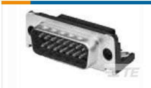
TE 产品编号5788794-2 25 HTMSFL PLUG RA 318 (IN,BL)