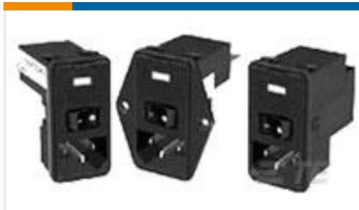
TE 产品编号4-1609155-2 PE0S0DMXE=C7106