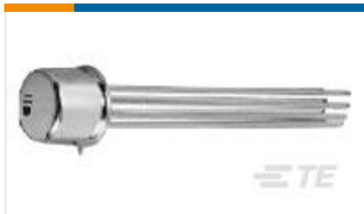
TE 产品编号2-1617164-4 JMAPT-6XP = M28776/1-020P