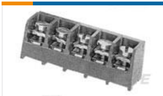
TE 产品编号6-1546158-7 6PCV-13-007=0.375 SERIES #6 TR