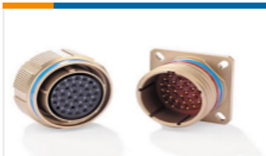
TE 产品编号ZPF0000000000015789 DTB 26 B 11-01 AN