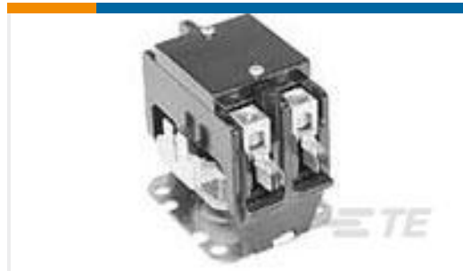
TE 产品编号2-1611004-4 3100-20T18999CL=40A 2P 120V PR