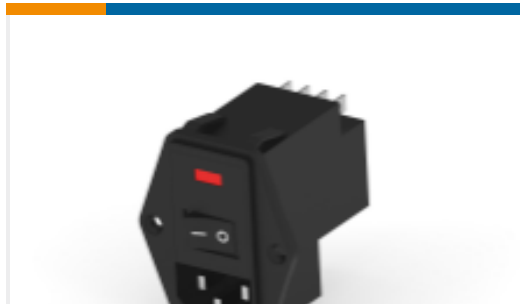
TE 产品编号6609104-4 PE0S0SS60=C1129