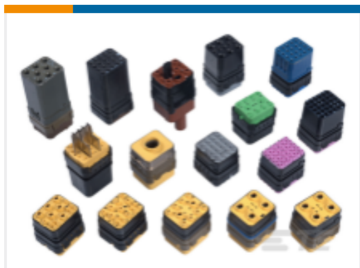
TE 产品编号ZPF000000000148762 DMC-M 99-04 AN (=33537-P0000)