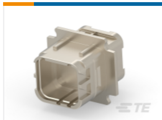
TE 产品编号ZPF000000000146309 Rectangular Connector Receptacle Extenders, Tool-less Assembly