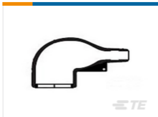
TE 产品编号EF9981-000 222K121-25L/225-0