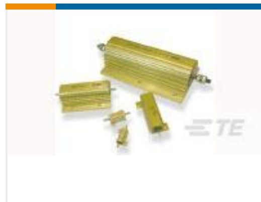
TE 产品编号1-1630019-4 HSC200 2K4 5%