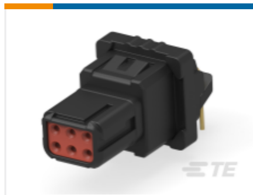
TE 产品编号YD369-B99-AP400000 Rectangular Connectors: 9-Way Panel Mount, 90PCB