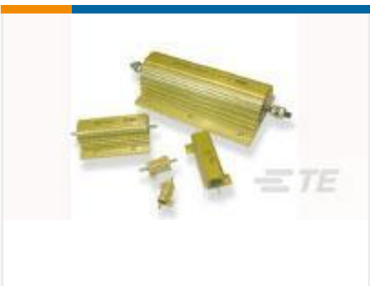
TE 产品编号1-1630019-4 HSC200 2K4 5%