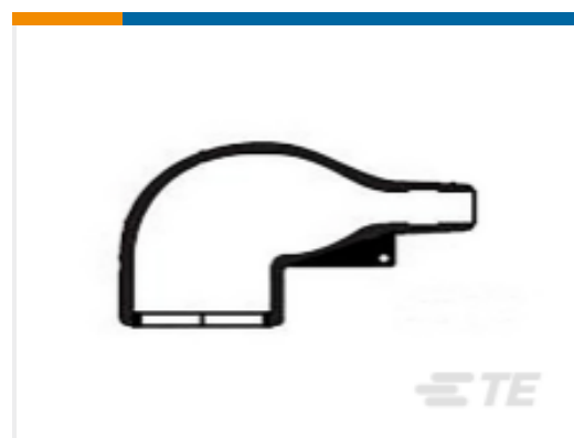
TE 产品编号EF9981-000 222K121-25L/225-0