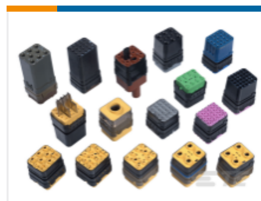
TE 产品编号ZPF000000000148762 DMC-M 99-04 AN (=33537-P0000)