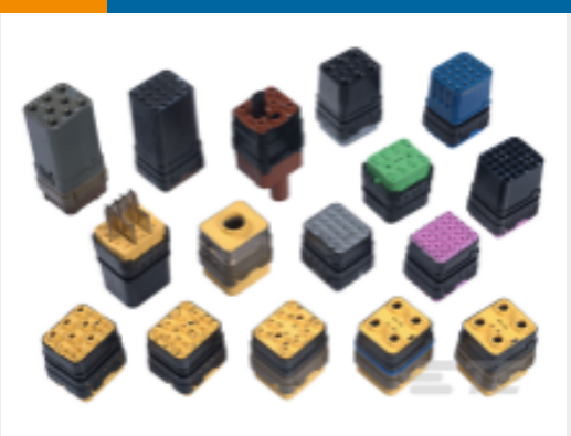
TE 产品编号ZPF000000000148762 DMC-M 99-04 AN (=33537-P0000)