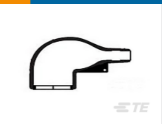
TE 产品编号EF9981-000 222K121-25L/225-0