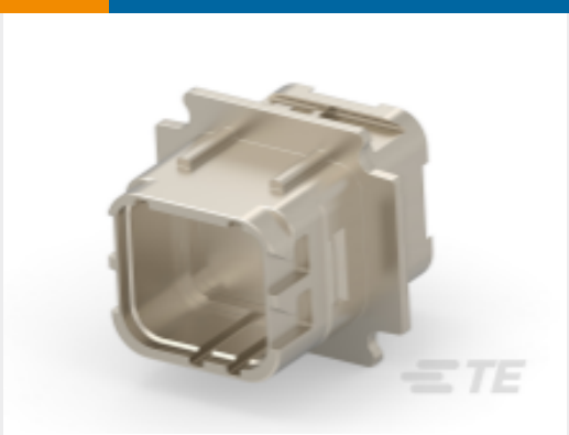
TE 产品编号ZPF000000000146309 Rectangular Connector Receptacle Extenders, Tool-less Assembly