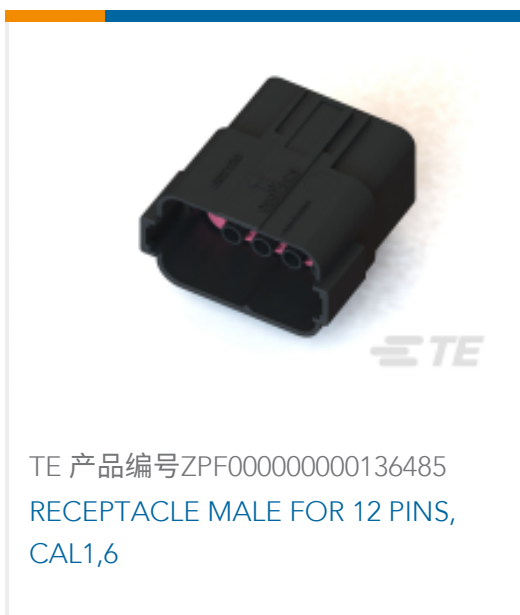
TE 产品编号 ZPF000000000136485 RECEPTACLE MALE FOR 12 PINS, CAL1,6