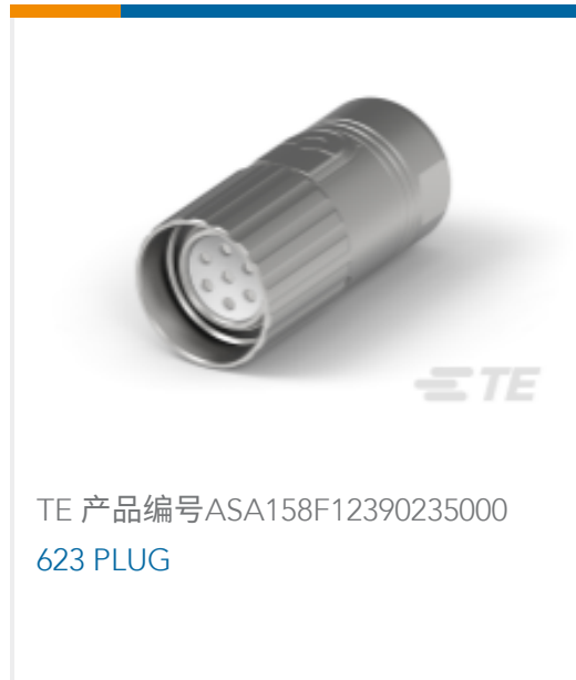
TE 产品编号 ASA158F12390235000 623 PLUG