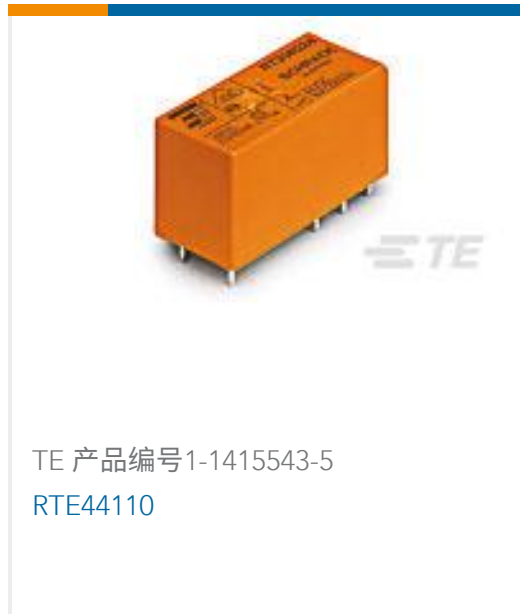
TE 产品编号 1-1415543-5 RTE44110