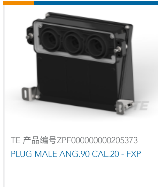
TE 产品编号 ZPF000000000205373 PLUG MALE ANG.90 CAL.20 - FXP