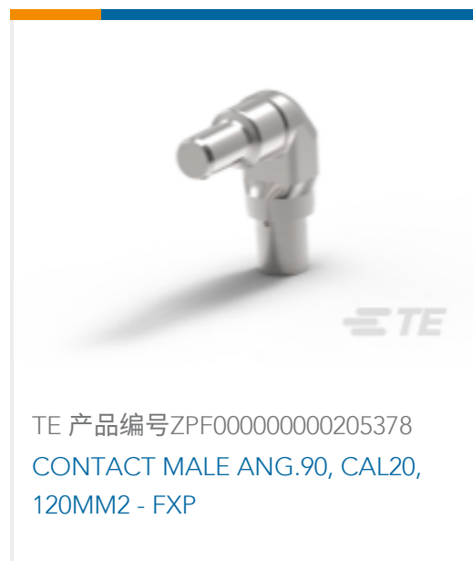
TE 产品编号 ZPF000000000205378 CONTACT MALE ANG.90, CAL20, 120MM2 - FXP