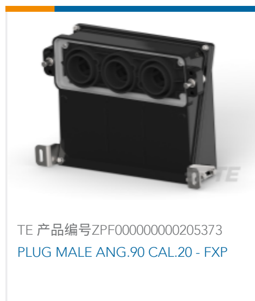
TE 产品编号 ZPF000000000205373 PLUG MALE ANG.90 CAL.20 - FXP