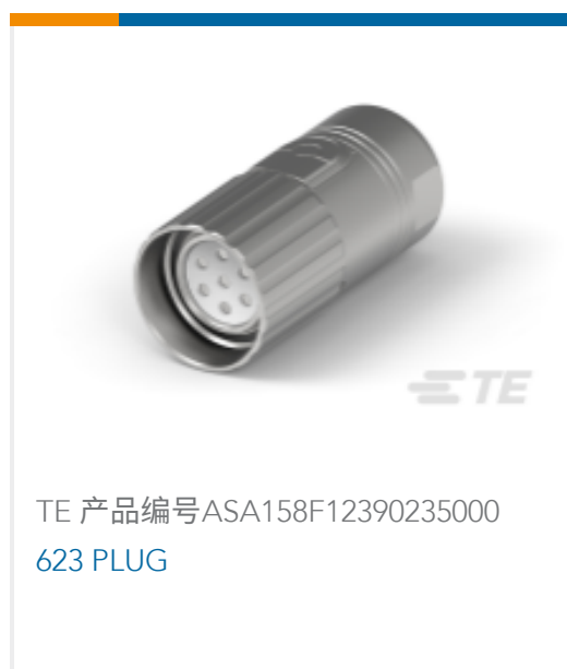
TE 产品编号 ASA158F12390235000 623 PLUG