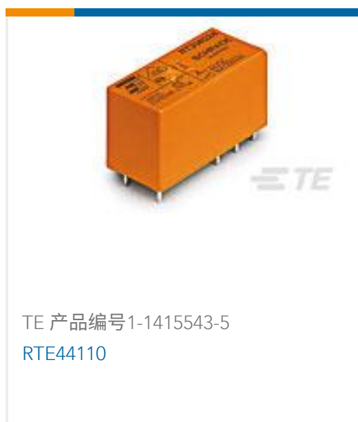
TE 产品编号 1-1415543-5 RTE44110