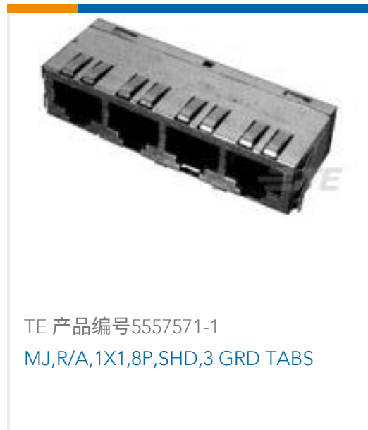
TE 产品编号5557571-1 MJ,R/A,1X1,8P,SHD,3 GRD TABS