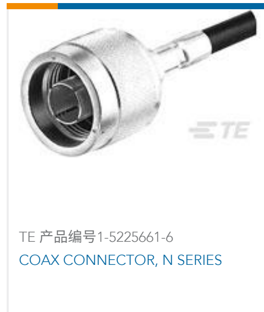
TE 产品编号1-5225661-6 COAX CONNECTOR, N SERIES