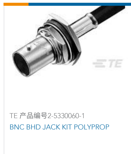
TE 产品编号2-5330060-1 BNC BHD JACK KIT POLYPROP