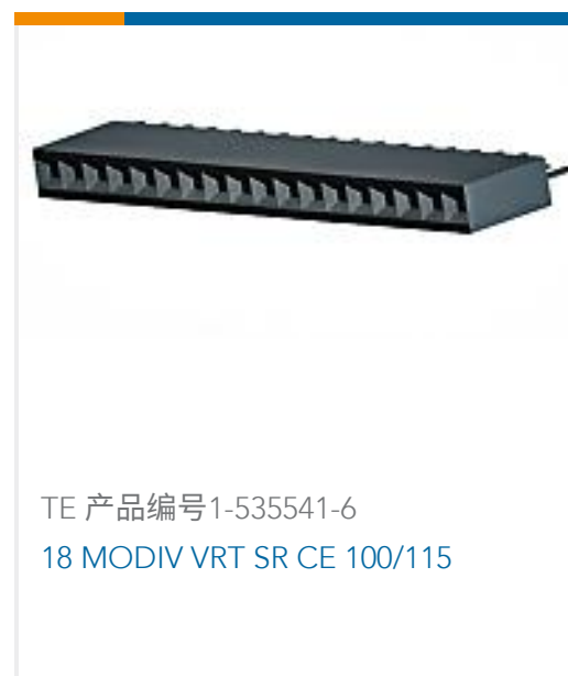
TE 产品编号1-535541-6 18 MODIV VRT SR CE 100/115