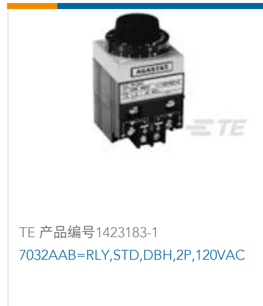
TE 产品编号1423183-1 7032AAB=RLY,STD,DBH,2P,120VAC