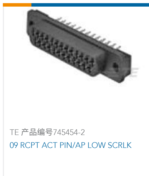
TE 产品编号745454-2 09 RCPT ACT PIN/AP LOW SCRLK