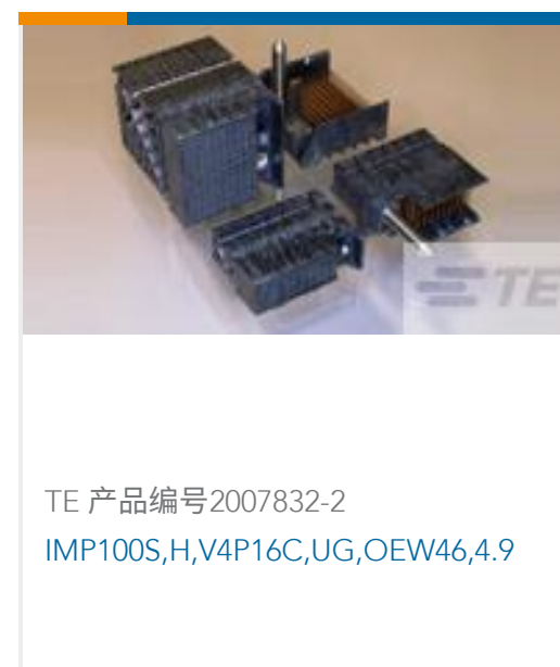
TE 产品编号2007832-2 IMP100S,H,V4P16C,UG,OEW46,4.9