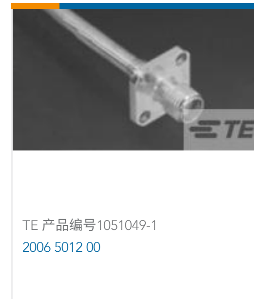
TE 产品编号1051049-1 2006 5012 00