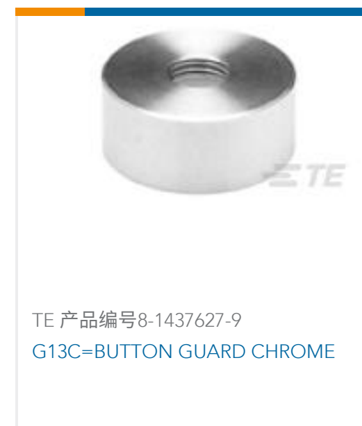
TE 产品编号8-1437627-9 G13C=BUTTON GUARD CHROME