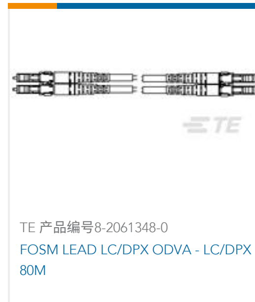
TE 产品编号8-2061348-0 FOSM LEAD LC/DPX ODVA - LC/DPX 80M