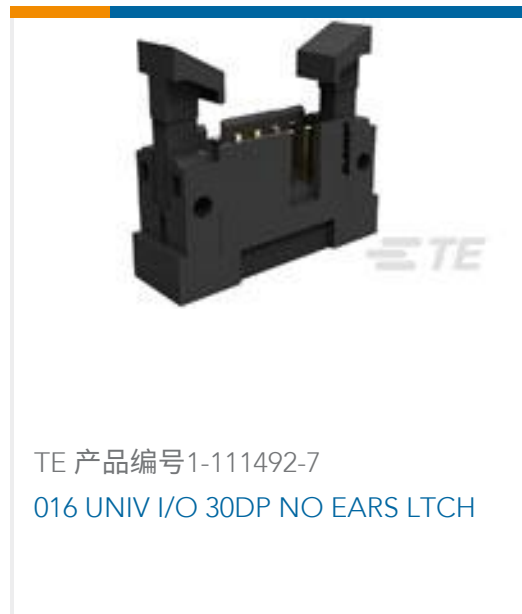
TE 产品编号1-111492-7 016 UNIV I/O 30DP NO EARS LTCH