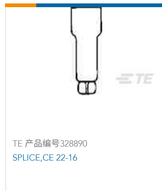
TE 产品编号328890 SPLICE, CE 22-16