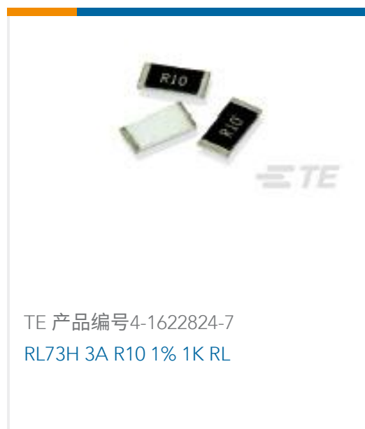
TE 产品编号4-1622824-7 RL73H 3A R10 1% 1K RL