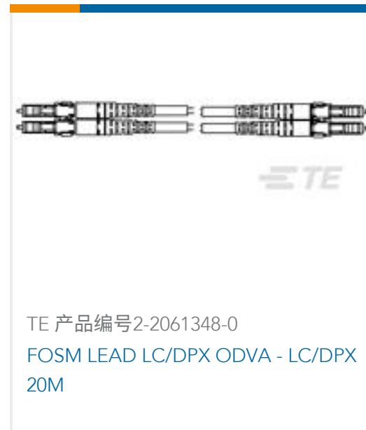
TE 产品编号2-2061348-0 FOSM LEAD LC/DPX ODVA - LC/DPX 20M