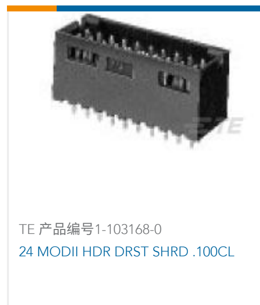
TE 产品编号1-103168-0 24 MODII HDR DRST SHRD .100CL