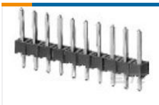
TE 产品编号5-146274-4 04 MODII HDR SRST B/A .100CL