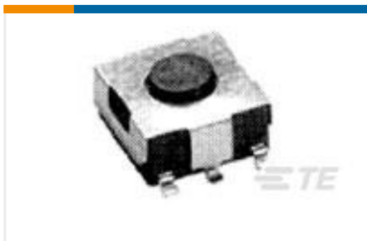
TE 产品编号1-1437565-9 FSM1LPTR=NEW P/N