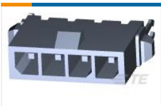
TE 产品编号2-1445085-4 micro mnl hdr assy s/row au lf