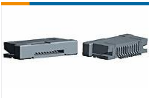
TE 产品编号3-1734592-6 FPC CONN. 0.5MM PITCH B/C, 36P