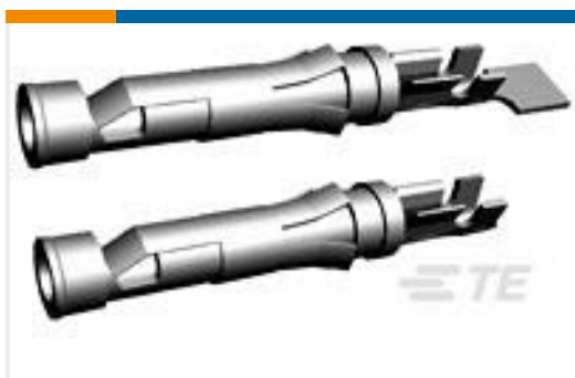
TE 产品编号66101-1 III+ SKT,18-16,30AU>10,LP