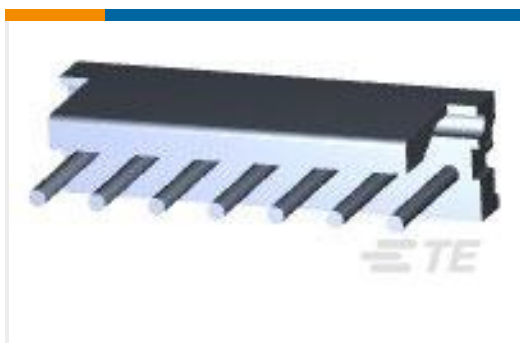
TE 产品编号640388-7 07P MTA156 HDR ASSY RN STR F/L