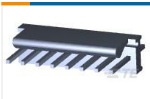
TE 产品编号3-641126-8 08P MTA100 HDR ASY FL/STR LF