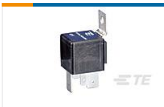
TE 产品编号3-1414937-3 V23134J0065X497-EV-CBOX