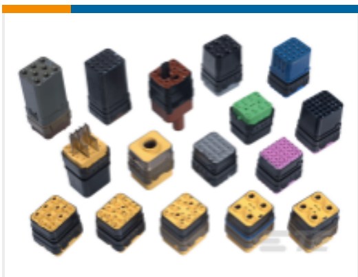
TE 产品编号ZPF00000000148762 DMC-M 99-04 AN (=33537-P0000)