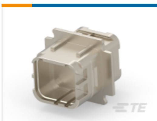
TE 产品编号ZPF000000000146309 Rectangular Connector Receptacle Extenders, Tool-less Assembly