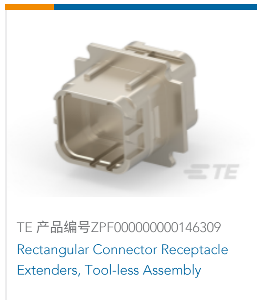
TE 产品编号 ZPF00000000146309 Rectangular Connector Receptacle Extenders, Tool-less Assembly