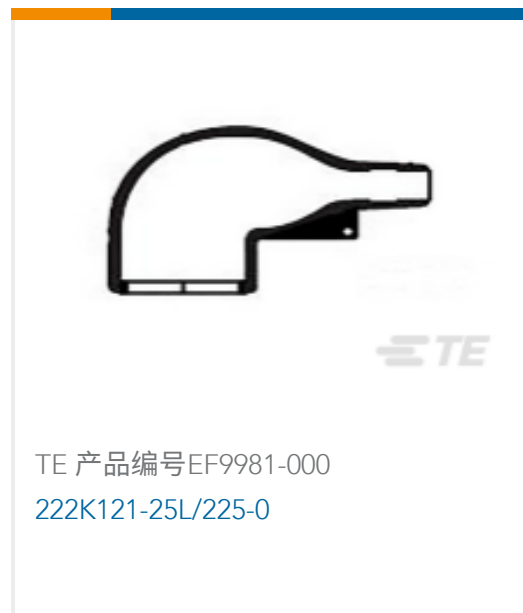
TE 产品编号 EF9981-000 222K121-25L/225-0