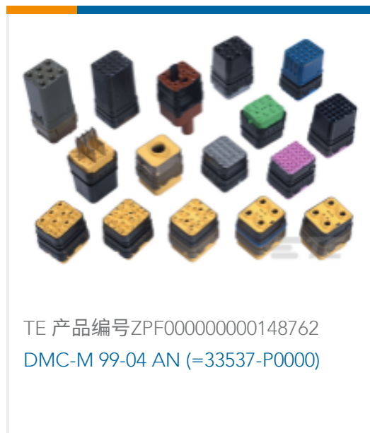
TE 产品编号 ZPF00000000148762 DMC-M 99-04 AN (=33537-P0000)