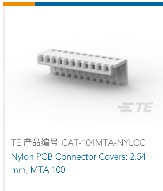
TE 产品编号 CAT-104MTA-NYLCC Nylon PCB Connector Covers: 2.54 mm, MTA 100