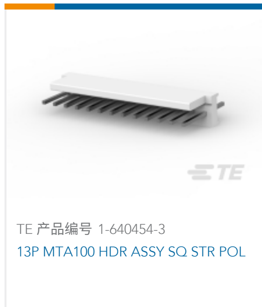
TE 产品编号 1-640454-3 13P MTA100 HDR ASSY SQ STR POL