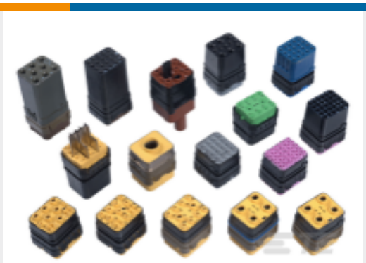
TE 产品编号ZPF000000000148762 DMC-M 99-04 AN (=33537-P0000)