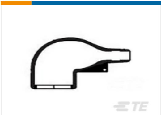
TE 产品编号EF9981-000 222K121-25L/225-0