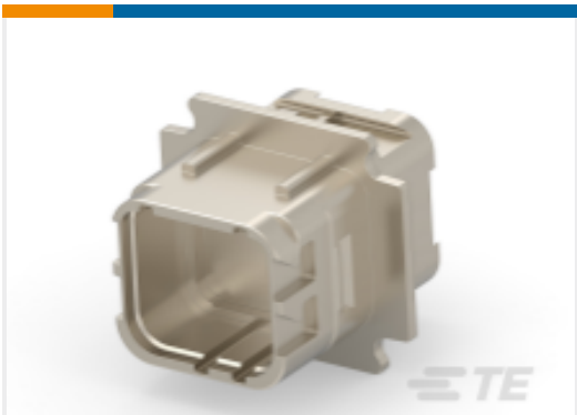
TE 产品编号ZPF000000000146309 Rectangular Connector Receptacle Extenders, Tool-less Assembly