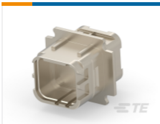
TE 产品编号ZPF000000000146309 Rectangular Connector Receptacle Extenders, Tool-less Assembly