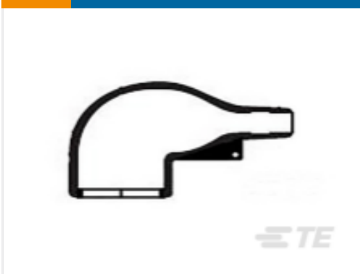
TE 产品编号EF9981-000 222K121-25L/225-0