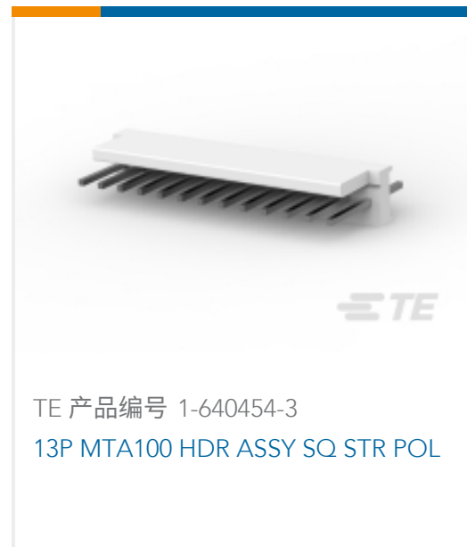
TE 产品编号 1-640454-3 13P MTA100 HDR ASSY SQ STR POL