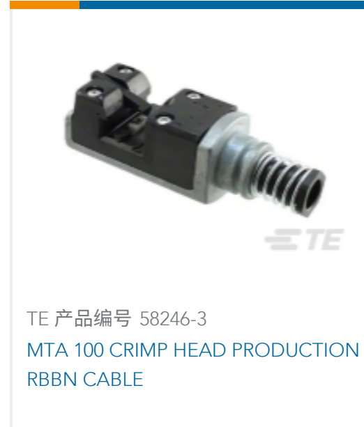
TE 产品编号 58246-3 MTA 100 CRIMP HEAD PRODUCTION RBBN CABLE