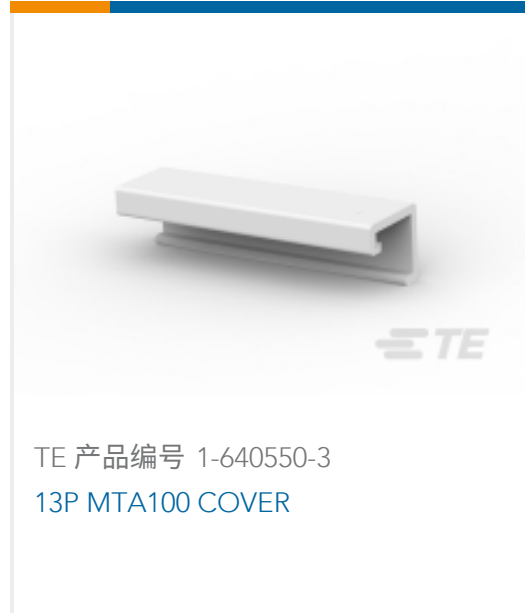
TE 产品编号 1-640550-3 13P MTA100 COVER