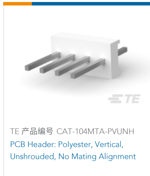
TE 产品编号 CAT-104MTA-PVUNH PCB Header: Polyester, Vertical, Unshrouded, No Mating Alignment