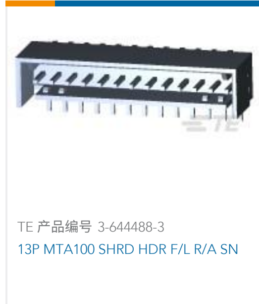
TE 产品编号 3-644488-3 13P MTA100 SHRD HDR F/L R/A SN