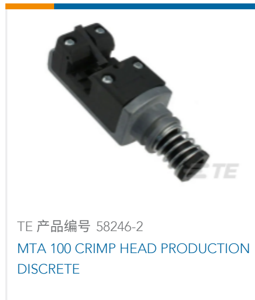
TE 产品编号 58246-2 MTA 100 CRIMP HEAD PRODUCTION DISCRETE