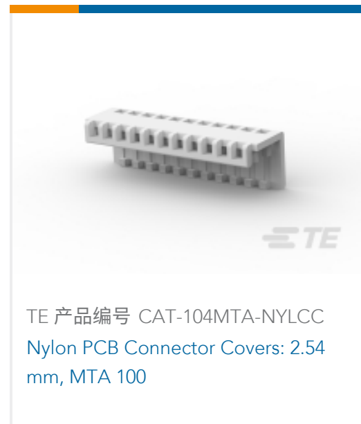
TE 产品编号 CAT-104MTA-NYLCC Nylon PCB Connector Covers: 2.54 mm, MTA 100