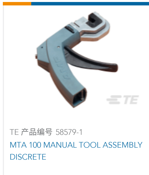
TE 产品编号 58579-1 MTA 100 MANUAL TOOL ASSEMBLY DISCRETE