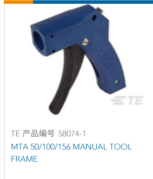
TE 产品编号 58074-1 MTA 50/100/156 MANUAL TOOL FRAME