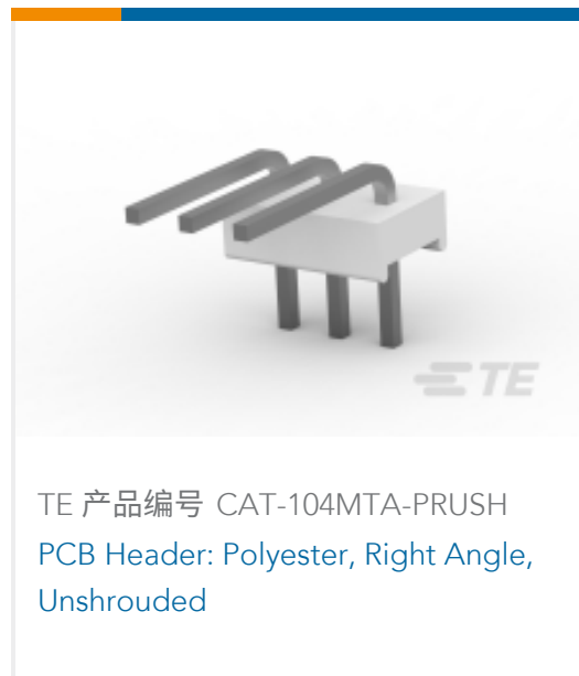
TE 产品编号 CAT-104MTA-PRUSH PCB Header: Polyester, Right Angle, Unshrouded