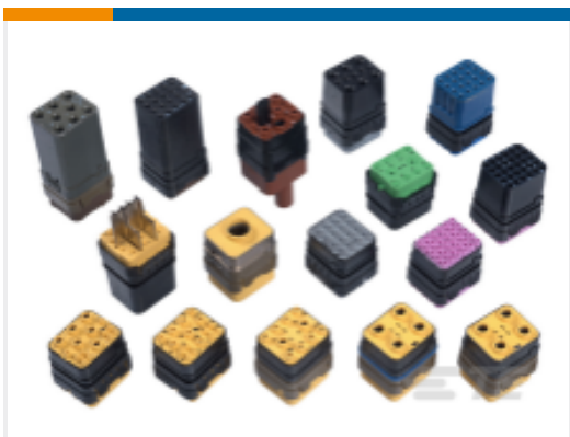
TE 产品编号ZPF00000000148762 DMC-M 99-04 AN (=33537-P0000)