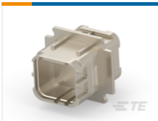
TE 产品编号ZPF00000000146309 Rectangular Connector Receptacle Extenders, Tool-less Assembly