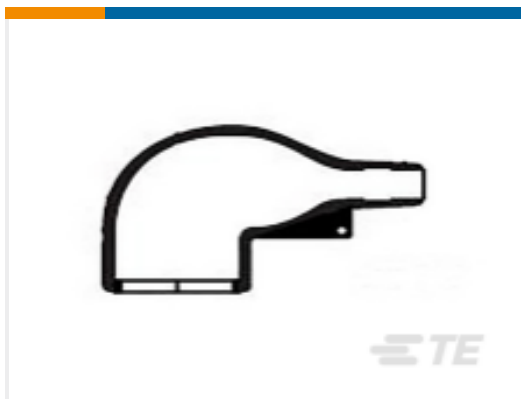
TE 产品编号EF9981-000 222K121-25L/225-0