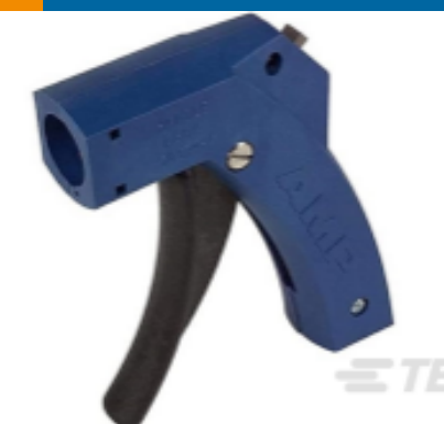
TE 产品编号 58074-1 MTA 50/100/156 MANUAL TOOL FRAME