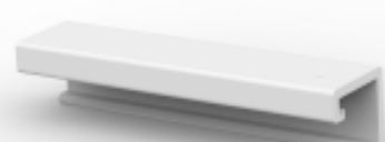
TE 产品编号 1-640550-5 15P MTA100 COVER