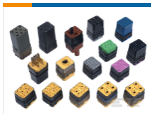
TE 产品编号ZPF000000000148762 DMC-M 99-04 AN (=33537-P0000)