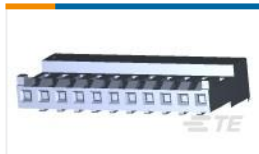
TE 产品编号4-643819-1 11P MTA156 CONN ASSY 22AWG LF