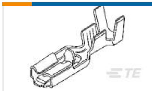
TE 产品编号63097-1 250 PL MKII REC. 18-14AWG TPBR