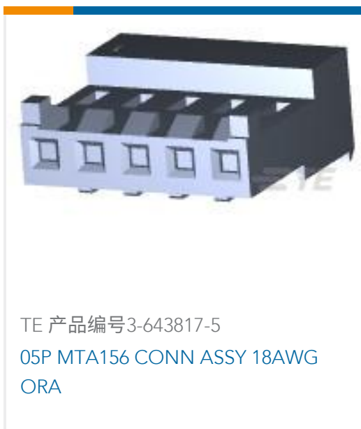
TE 产品编号3-643817-5 05P MTA156 CONN ASSY 18AWG ORA