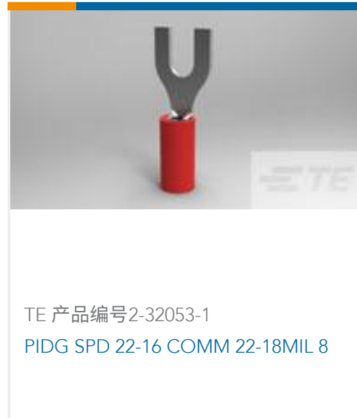
TE 产品编号2-32053-1 PIDG SPD 22-16 COMM 22-18MIL 8