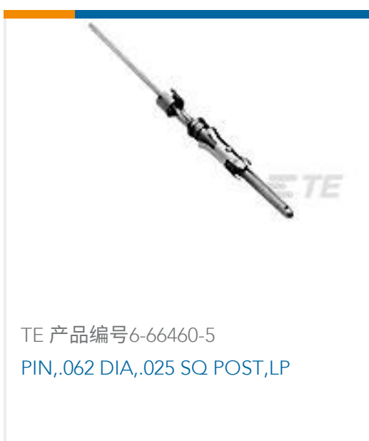
TE 产品编号6-66460-5 PIN, .062 DIA, .025 SQ POST, LP