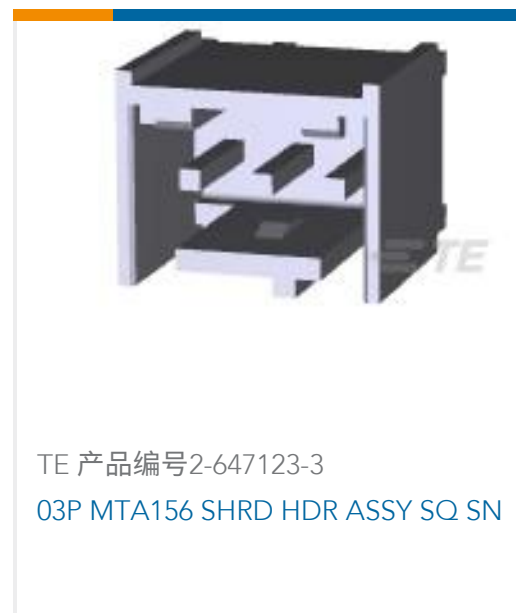
TE 产品编号2-647123-3 03P MTA156 SHRD HDR ASSY SQ SN