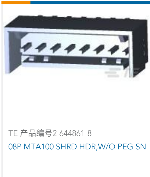
TE 产品编号2-644861-8 08P MTA100 SHRD HDR, W/O PEG SN