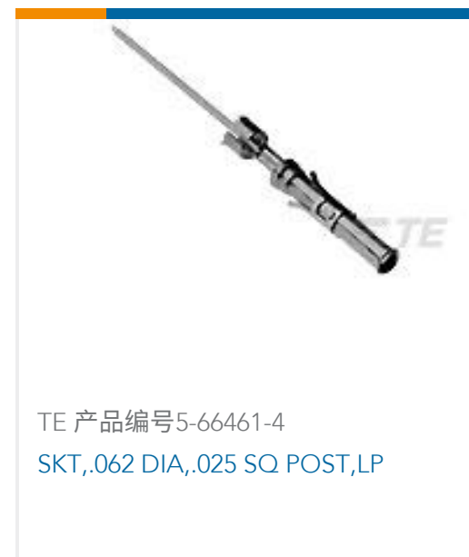
TE 产品编号5-66461-4 SKT, .062 DIA, .025 SQ POST, LP