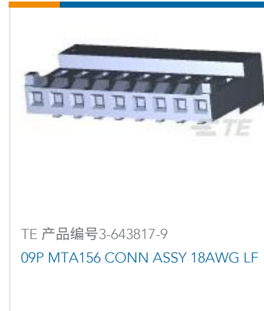
TE 产品编号3-643817-9 09P MTA156 CONN ASSY 18AWG LF