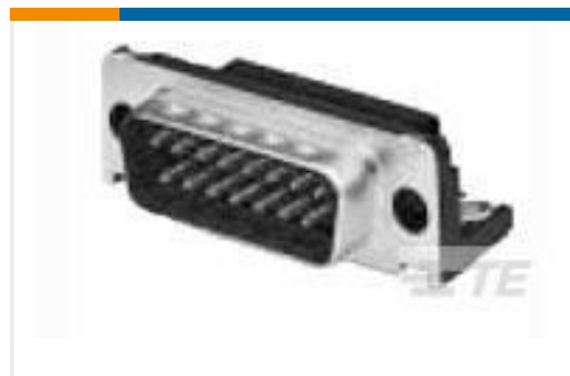
TE 产品编号788793-1 09 HTMSFL PLUG RA 318 (SL,BL)