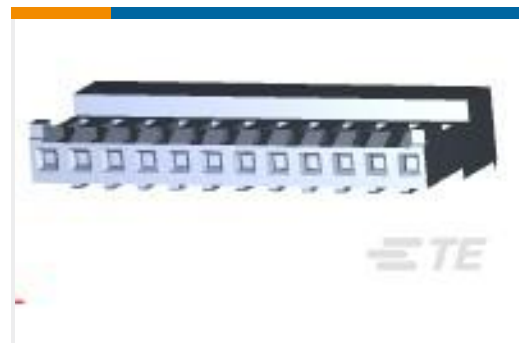
TE 产品编号4-643819-2 12P MTA156 CONN ASSY 22AWG LF