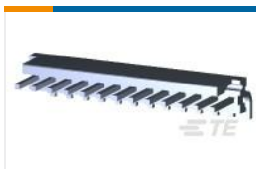
TE 产品编号1-640389-3 13P MTA156 HDR ASSY SQ R/A F/L