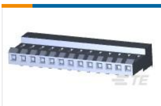
TE 产品编号4-640426-3 13P MTA156 CONN ASSY 18AWG ORA