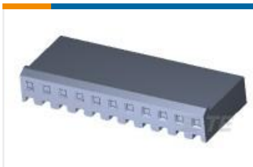
TE 产品编号1-640250-1 11P SL156 HSG W/LCK RAMP NATL