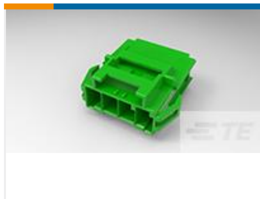
TE 产品编号7-2232263-4 PTL 1X4 CAP PANEL MT GLW WIRE KEY C GRN