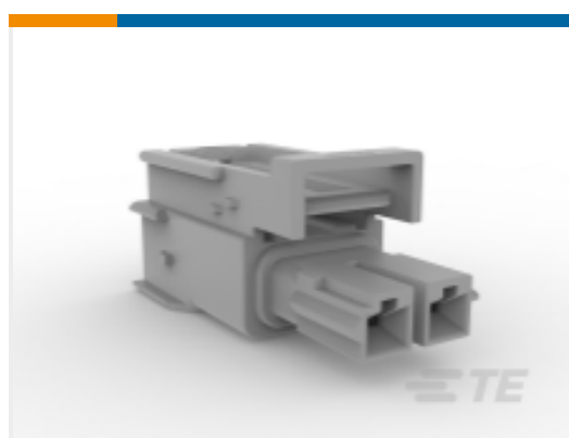
TE 产品编号2-2378159-2 Power Versa-Lock PLUG, 1X2 KEY B