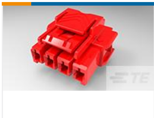
TE 产品编号8-2232265-4 PTL 1X4 PLUG HSG GLW WIRE KEY D ORA