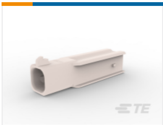
TE 产品编号1-2345729-1 Power Versa-Lock FH CAP, 1X1 KEY A