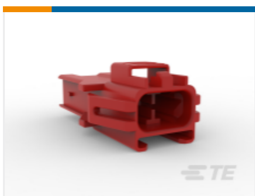
TE 产品编号4-2378158-2 Power Versa-Lock CAP, 1X2 KEY D