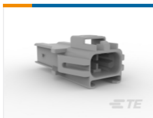
TE 产品编号2-2378158-2 Power Versa-Lock CAP, 1X2 KEY B