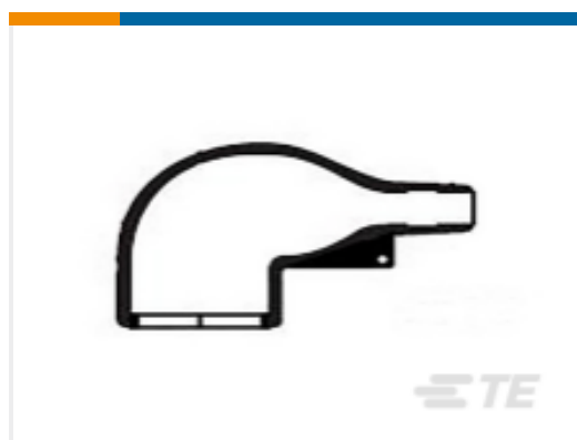
TE 产品编号EF9981-000 222K121-25L/225-0