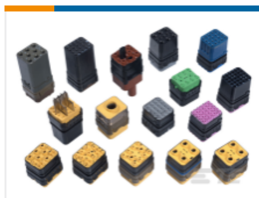
TE 产品编号ZPF000000000148762 DMC-M 99-04 AN (=33537-P0000)