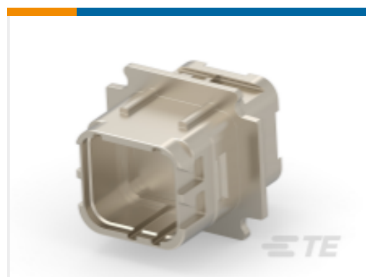
TE 产品编号ZPF000000000146309 Rectangular Connector Receptacle Extenders, Tool-less Assembly