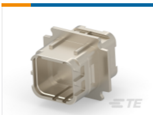
TE 产品编号ZPF000000000146309 Rectangular Connector Receptacle Extenders, Tool-less Assembly