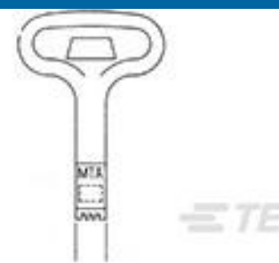
TE 产品编号 59804-1 MAINTENANCE TOOL