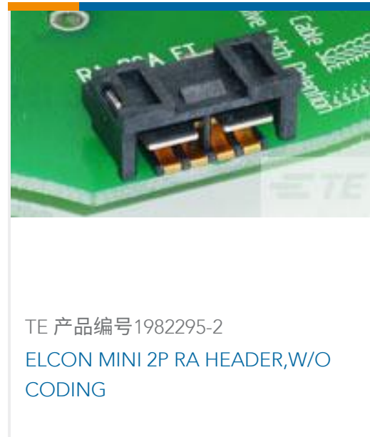
TE 产品编号1982295-2 ELCON MINI 2P RA HEADER,W/O CODING