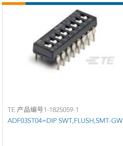
TE 产品编号1-1825059-1 ADF03ST04=DIP SWT,FLUSH,SMT-GW