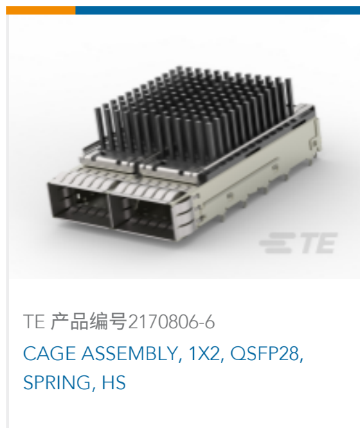
TE 产品编号2170806-6 CAGE ASSEMBLY, 1X2, QSFP28, SPRING, HS