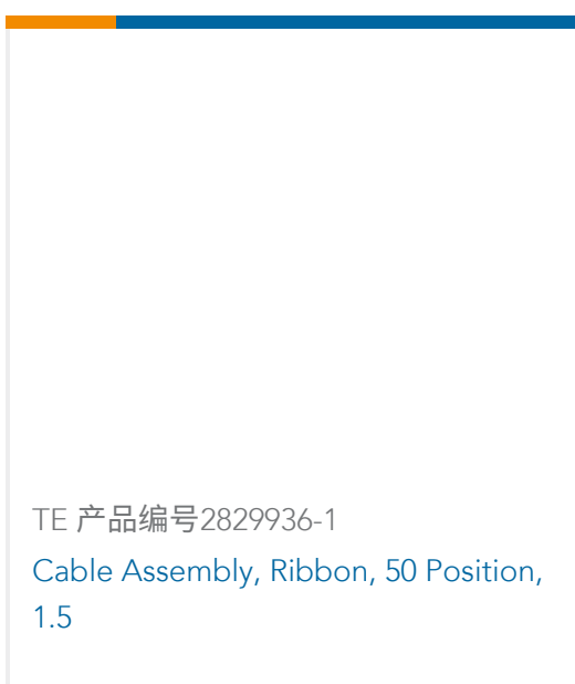
TE 产品编号2829936-1 Cable Assembly, Ribbon, 50 Position, 1.5