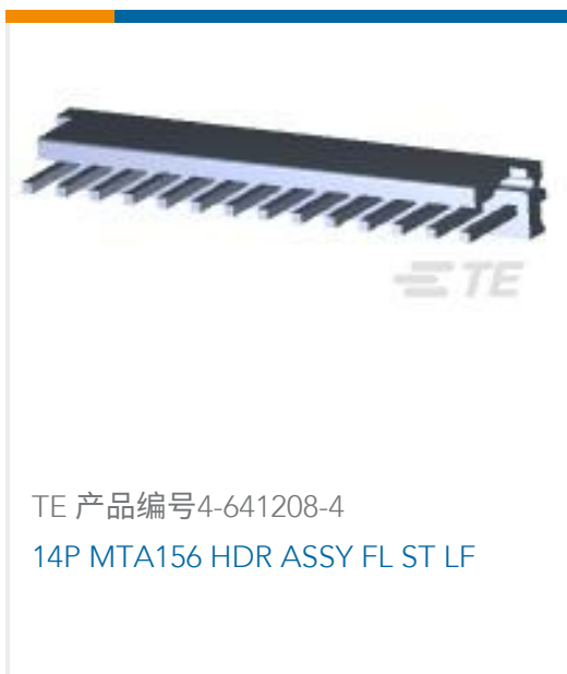
TE 产品编号4-641208-4 14P MTA156 HDR ASSY FL ST LF