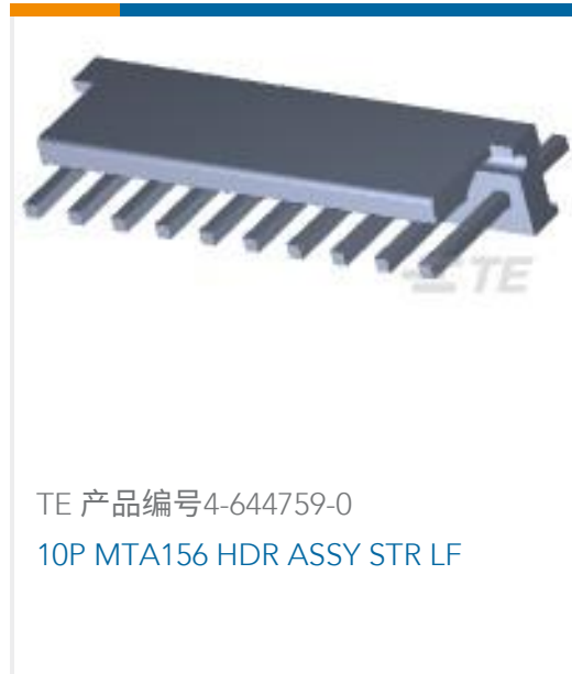
TE 产品编号4-644759-0 10P MTA156 HDR ASSY STR LF