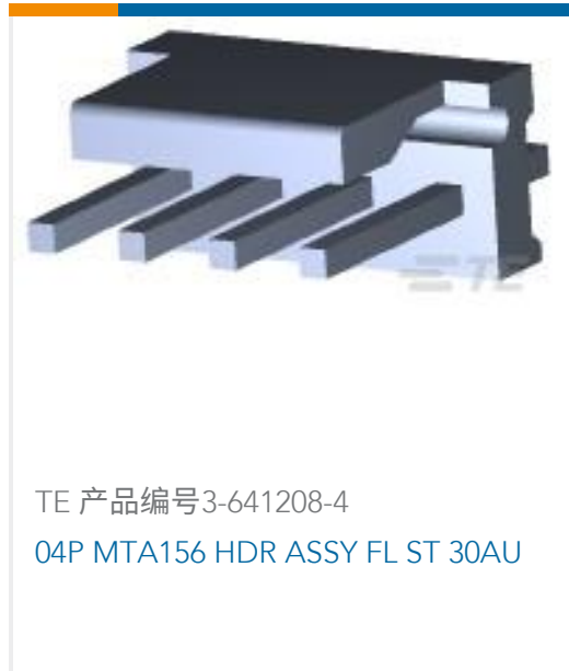
TE 产品编号3-641208-4 04P MTA156 HDR ASSY FL ST 30AU