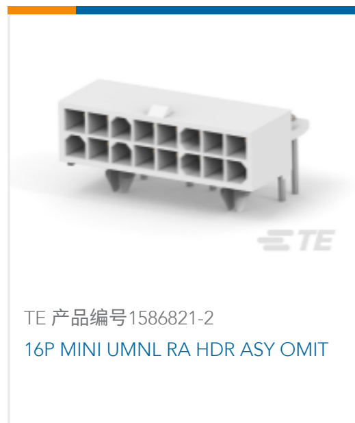
TE 产品编号1586821-2 16P MINI UMNL RA HDR ASY OMIT