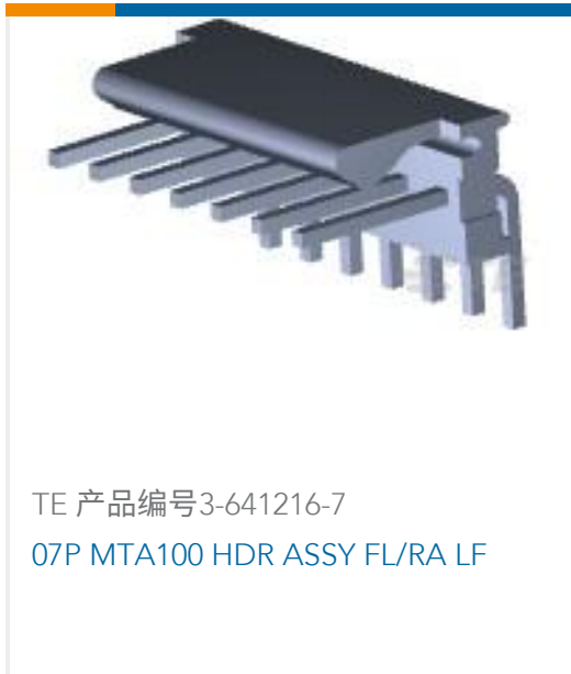
TE 产品编号3-641216-7 07P MTA100 HDR ASSY FL/RA LF