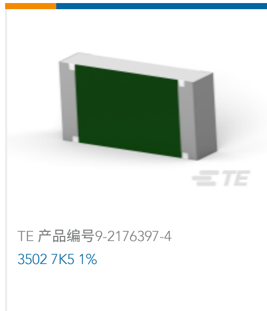
TE 产品编号9-2176397-4 3502 7K5 1%