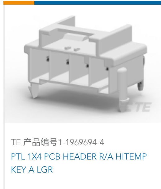
TE 产品编号1-1969694-4 PTL 1X4 PCB HEADER R/A HITEMP KEY A LGR