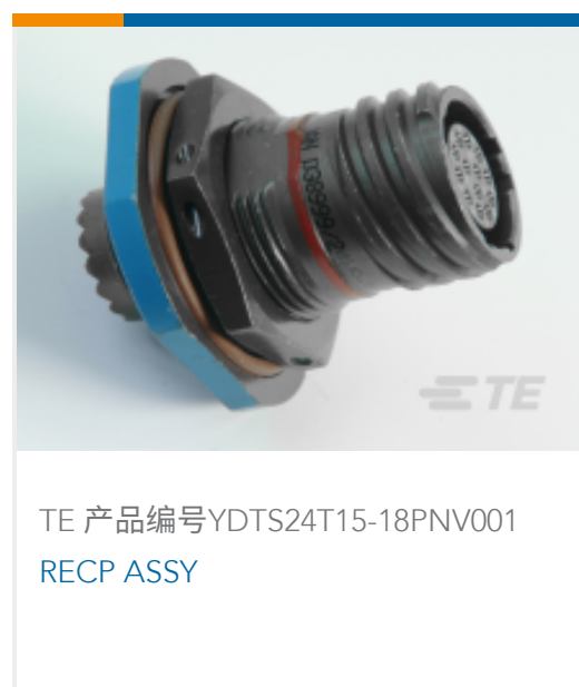
TE 产品编号YDTS24T15-18PNV001 RECP ASSY