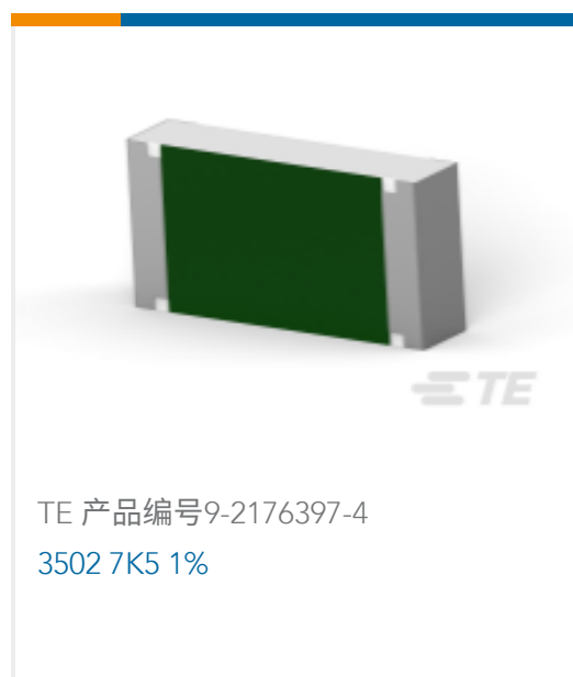
TE 产品编号9-2176397-4 3502 7K5 1%