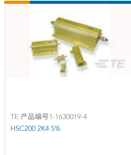
TE 产品编号1-1630019-4 HSC200 2K4 5%