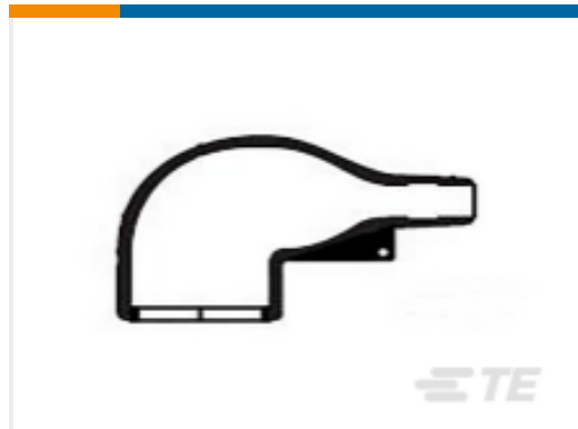
TE 产品编号EF9981-000 222K121-25L/225-0