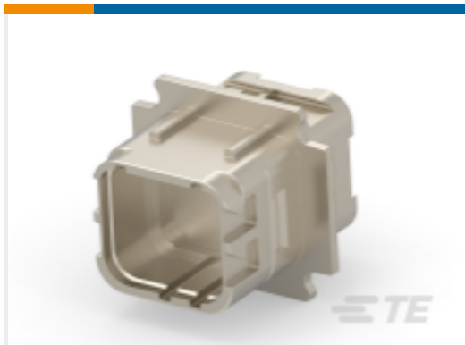
TE 产品编号ZPF000000000146309 Rectangular Connector Receptacle Extenders, Tool-less Assembly