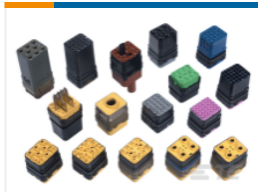
TE 产品编号ZPF000000000148762 DMC-M 99-04 AN (=33537-P0000)