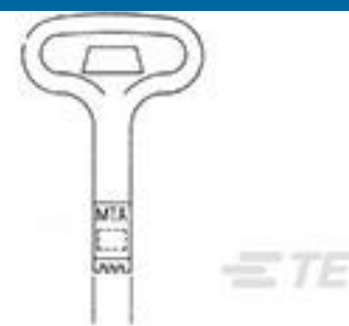
TE 产品编号 59804-1 MAINTENANCE TOOL