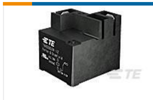
TE 产品编号2-1419104-1 T9AS1D22-24