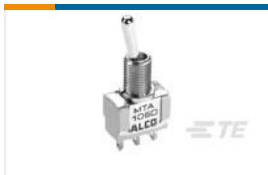
TE 产品编号1-1437558-0 MTA106D=(MSTA) SWITCH TOGGLE S