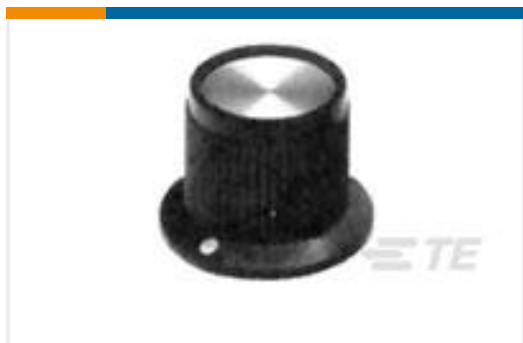
TE 产品编号1437624-7 PK50B1/8=KNOB PLASTIC BLK 1/8