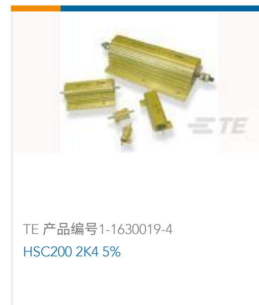
TE 产品编号1-1630019-4 HSC200 2K4 5%