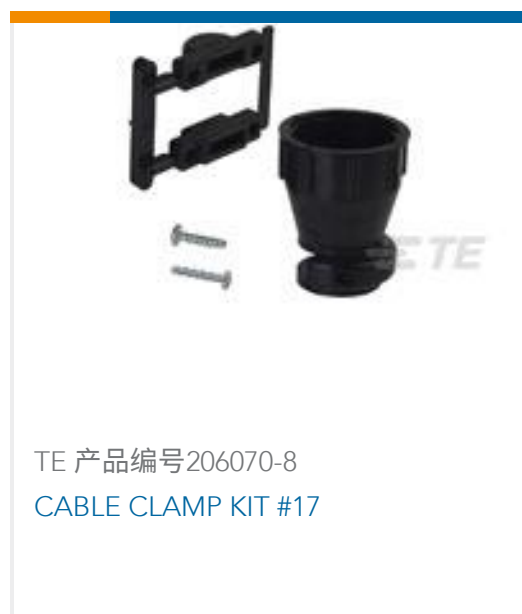
TE 产品编号206070-8 CABLE CLAMP KIT #17