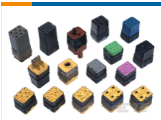
TE 产品编号ZPF000000000148762 DMC-M 99-04 AN (=33537-P0000)