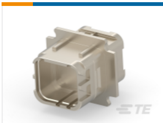
TE 产品编号ZPF000000000146309 Rectangular Connector Receptacle Extenders, Tool-less Assembly