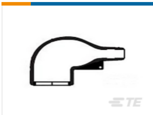
TE 产品编号EF9981-000 222K121-25L/225-0