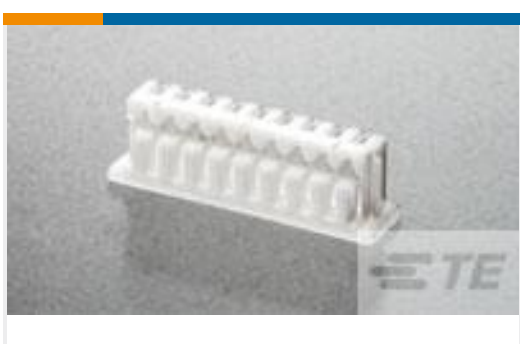
TE 产品编号440146-5 1.25mm WTB Socket,Housing,5p