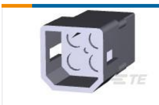
TE 产品编号770842-1 04P .093 COMM P&S PLUG