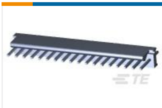
TE 产品编号1-640456-8 18P MTA100 HDR ASSY F/L SQ STR