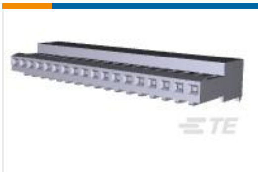
TE 产品编号4-640441-8 18P MTA100 CONN ASSY WHT