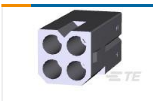
TE 产品编号770843-1 04P .093 COMM P&S RECPT