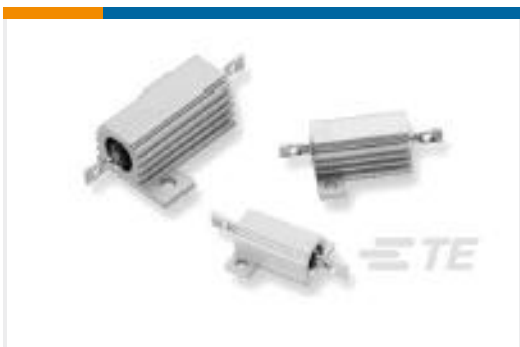
TE 产品编号3-1879075-3 THS25 50R 5%