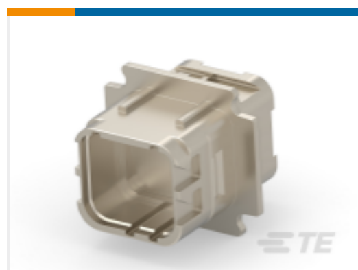
TE 产品编号ZPF000000000146309 Rectangular Connector Receptacle Extenders, Tool-less Assembly