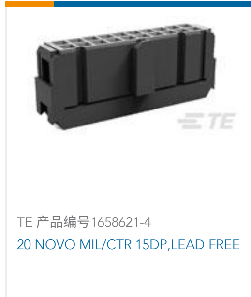
TE 产品编号1658621-4 20 NOVO MIL/CTR 15DP,LEAD FREE