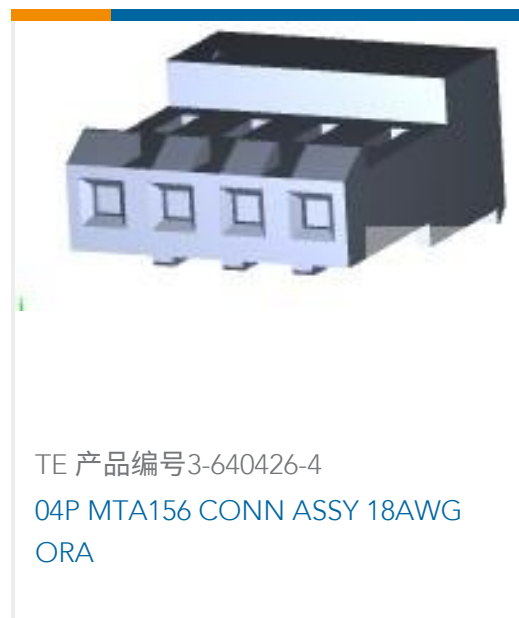
TE 产品编号3-640426-4 04P MTA156 CONN ASSY 18AWG ORA