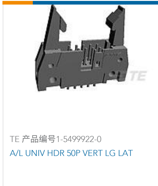
TE 产品编号1-5499922-0 A/L UNIV HDR 50P VERT LG LAT