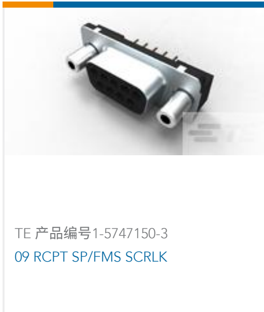
TE 产品编号1-5747150-3 09 RCPT SP/FMS SCRLK