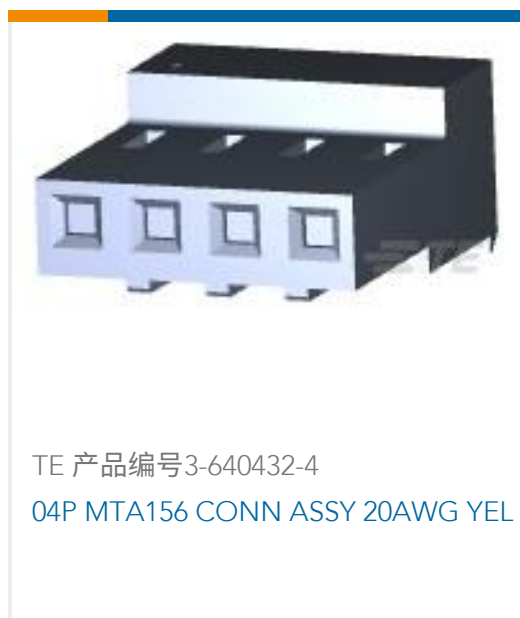
TE 产品编号3-640432-4 04P MTA156 CONN ASSY 20AWG YEL