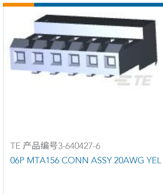
TE 产品编号3-640427-6 06P MTA156 CONN ASSY 20AWG YEL