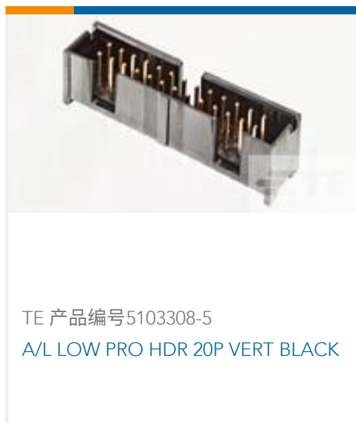
TE 产品编号5103308-5 A/L LOW PRO HDR 20P VERT BLACK