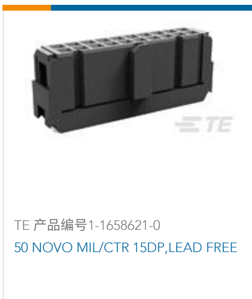
TE 产品编号1-1658621-0 50 NOVO MIL/CTR 15DP,LEAD FREE