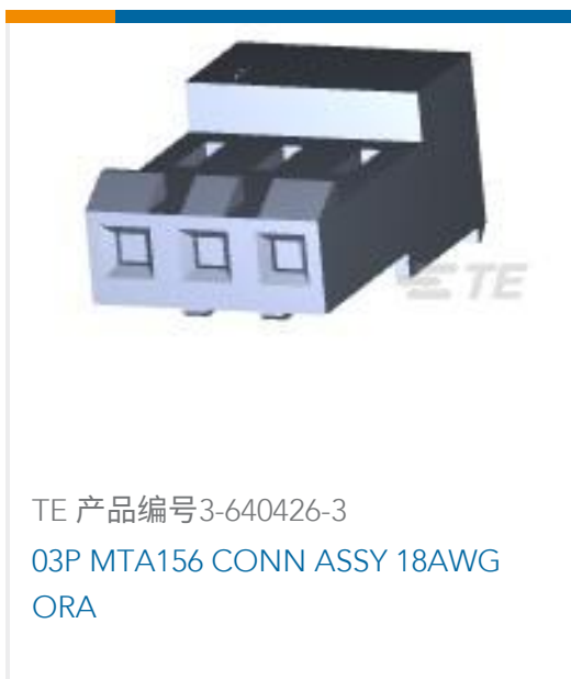
TE 产品编号3-640426-3 03P MTA156 CONN ASSY 18AWG ORA