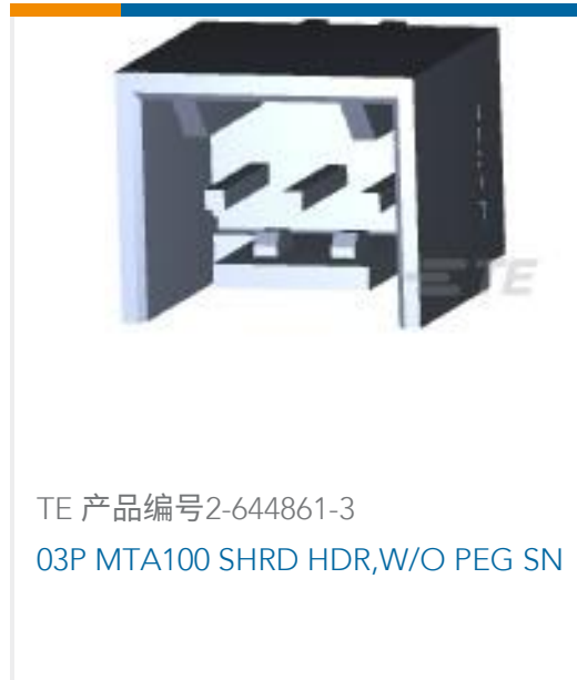
TE 产品编号2-644861-3 03P MTA100 SHRD HDR,W/O PEG SN