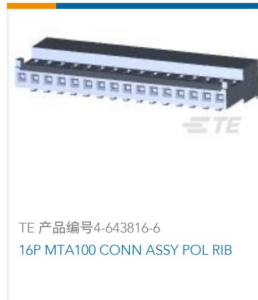
TE 产品编号4-643816-6 16P MTA100 CONN ASSY POL RIB