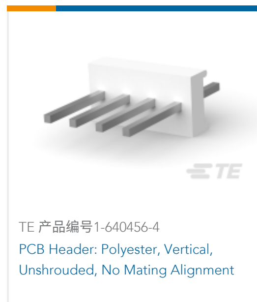
TE 产品编号1-640456-4 PCB Header: Polyester, Vertical, Unshrouded, No Mating Alignment