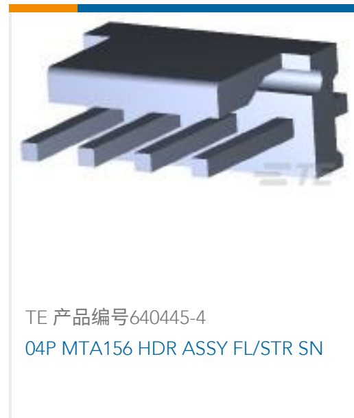
TE 产品编号640445-4 04P MTA156 HDR ASSY FL/STR SN