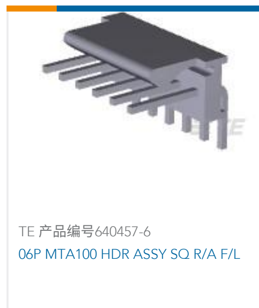
TE 产品编号640457-6 06P MTA100 HDR ASSY SQ R/A F/L