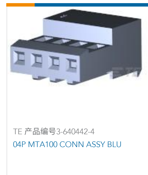
TE 产品编号3-640442-4 04P MTA100 CONN ASSY BLU