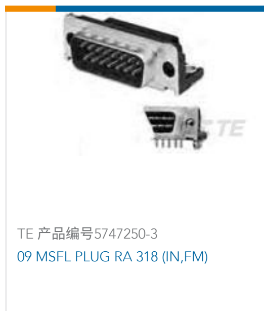
TE 产品编号5747250-3 09 MSFL PLUG RA 318 (IN,FM)