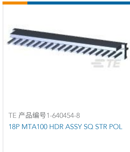
TE 产品编号1-640454-8 18P MTA100 HDR ASSY SQ STR POL